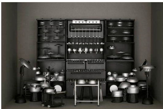
ドナ オン 「秘めたる、静かなる場所で(v)」 2008 年 エナメル絵具、ミニチュアプラスチック玩具、 プラスチック製品 44 x 37 cm