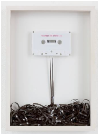
デュート ハルダーノ