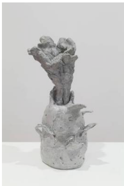
エリカ ヴェルズツティ 「カルボナーダ」 2010 年 コンクリート、ガラスビーズ 32 x 13 x 13 cm