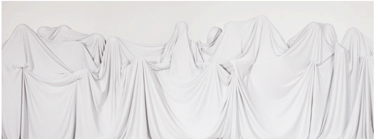
シャギニ ラトナウラン 「L.S.」 2011 年 写真(インクジェットプリント) 57.2 x 150.3 cm

インドネシア、シンガポール、インド、アフガニスタン、ブラジル、アルゼンチンそしてアメリカ さまざまな場所から集うアーティストが美術館に創る「共生」の場