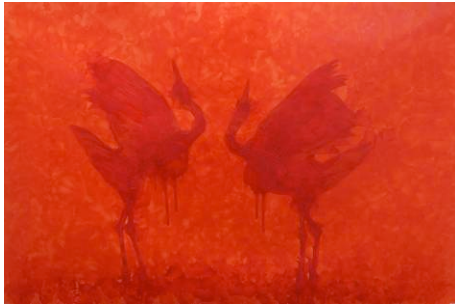
プラディーブ ミシュラ 「ウォームス オブ トゥゲザネス(9)」 2010 年 油絵具、キャンバス 138 x 209 cm