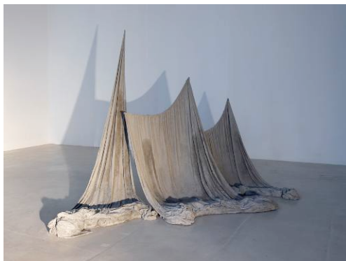
チアゴ ホシャ ピッタ 「地質大陸移動の記念碑」 2012 年 セメント、カンヴァス 170 x 250 x 100 cm (参考図版)