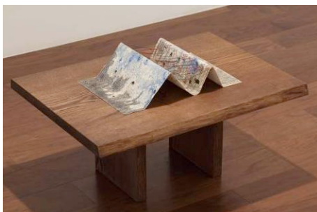
ムナム アパン 「ヒルサイド ストーリーズ: ネリとヨミ」 2009 年 綿糸、糊、ファブリアーノ・コールドプレス紙(400gsm) タモ材台座、26 x 56 x 8.5cm(作品) 35 x 70 x 35cm(台座)