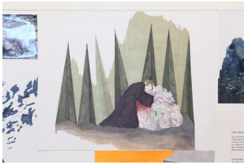
フロレンシア ロドリゲス ヒレス 「フィクショナル アイランズ」